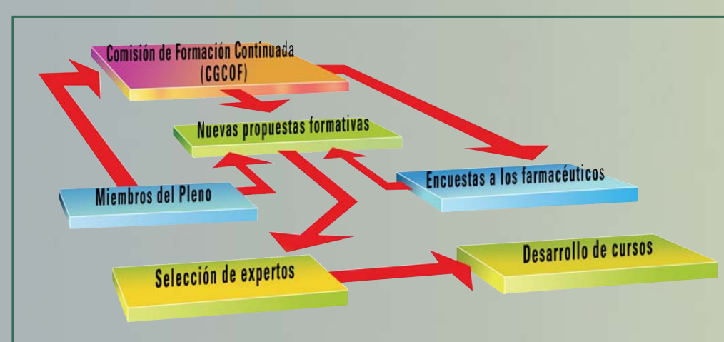
Figura 1.- Plan Nacional de Formación Continuada. Planificación de cursos

Tras la evaluación de cada módulo de un curso, la Comisión de Formación Continuada del Sistema Nacional de Salud, los considera acreedores de un número de créditos. La Tabla 2 muestra la acreditación asignada a cada curso acreditado hasta la fecha.