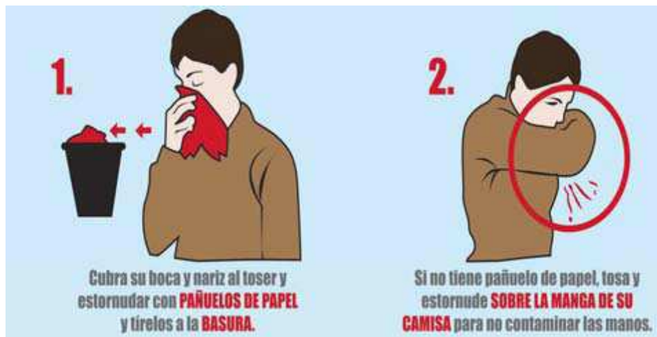
Figura 2.- Método de higiene respiratoria